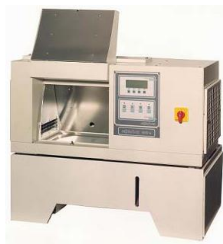
Solarbox 1500 E con FLOODING

Il sistema di allagamento standard funziona con acqua demineralizzata che viene riciclata tramite un circuito chiuso, consentendo un risparmio notevole di acqua demineralizzata rispetto ai sistemi spray a circuito aperto. Materiali in PVC e resistenti alla corrosione assicurano lunga vita al sistema. Capacità fino a 50 litri.