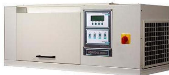
SOLARBOX 3000 E

Il calore radiante emesso dalla Lampada Xenon è continuamente monitorato e controllato da un sensore di temperatura del corpo nero B.S.T., inserito nel vassoio porta-campioni in modo da stabilizzare la temperatura nelle immediate vicinanze dei vostri campioni.