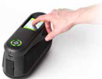
Intuitiva navigazione touch screen che agevola la misurazione